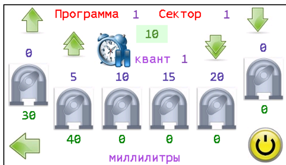
Экран дисплея в режиме ввода параметров