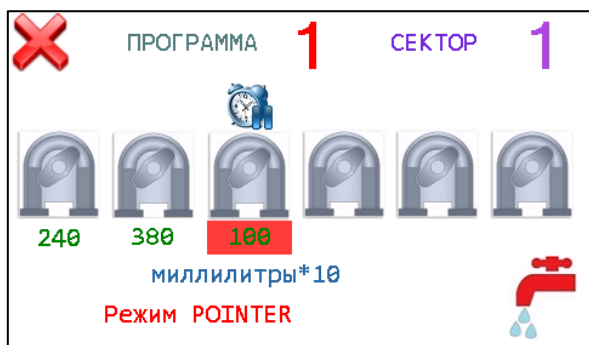
Экран дисплея в режиме реального времени